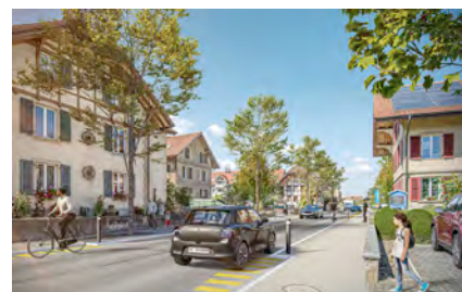
Umgestaltung Ortsdurchfahrt Oberburg