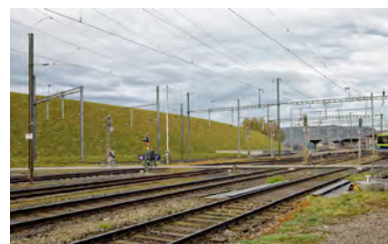
Neue Linienführung hinter dem Bahnhof von Hasle b.B.