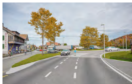
Sorgfältige Materialisierung und Gestaltung