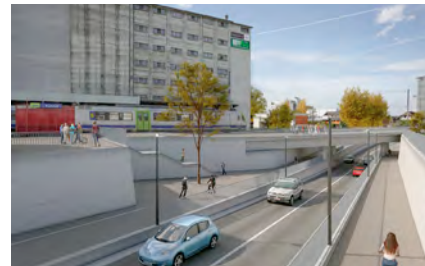
zwei neue Bahnunterführungen in Burgdorf