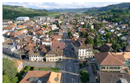
Oberburg: Chance zur Aufwertung und Verdichtung