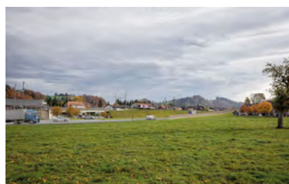
Umfahrung Hasle entlang des Bahndamms