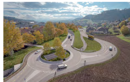
Kreisel Oberburg Nord mit Tunnel-einfahrt